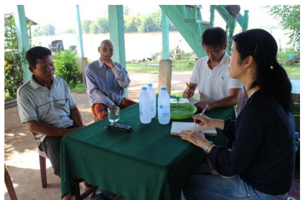
ラオス南部チャムパサック県のトーラティー島での物語の聞き取りの様子（2014 年 9 月 8 日）

メコン・ウォッチでは、タイ北部・東北部、ラオス北部・中部・南部、カンボジア東北部で、地域に伝わる伝説や民話などについての調査を行い、映像・音声・文字による記録を行ってきました。2014 年度には、3 カ国で 102 の伝説・昔話・ライフストーリーなどの「人びとの物語」を記録しました。そこには、アカ（タイ北部）、