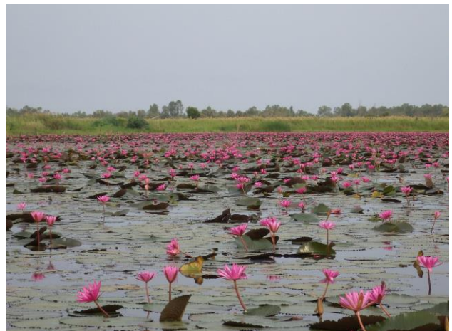
物語の舞台となったノーンハーン湖（タイ・ウドンタニ県）

2015年度には、タイ・ラオス・カンボジアで収集した物語から1話ずつを使って、小・中学生向けに環境教育を行うための教材『私たちのまわりの物語と自然資源』を発行し（※3）、各国で活動するNGOや住民組織、小・中学校、児童館、研究機関等に配布しました。