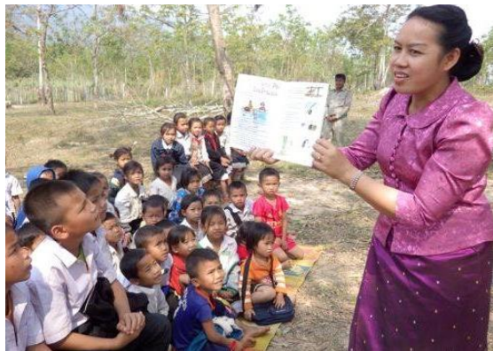
ラオス・ボリカムサイ県ボンサイ小学校でのワークショップの様子 (2016年3月4日)

パッカディン郡のボンサイ小学校の生徒を対象としたワークショップを開催しました。CCCのベテランスタッフが、ラオスの先住民族クム族に伝わる『フクロウとシカ』の物語 ( http://www.mekongwatch.org/PDF/FM11-1kamstory.pdf を参照) を語り聞かせた後、「私たちの村にも物語に出てきた動物がいるかな?」「象はどこに住んでいるの?」「森がなくなったら、動物たちはどうになってしまう?」といったファシリテーターの問いかけに、子供たちは元気よく答えてくれました。クム民族が90%を占める同小学校では、物語に出てくる実在・架空の動物になじみがあり、物語は身近な自然環境の変化を考えるきっかけになったようです。