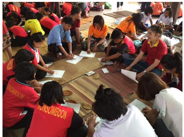
タイ・ウドンタニ県で開催された環境教育ワークショップで行われたデモンストレーション (2016年3月10日)

また、2016年3月には、タイのウドンタニ県で、タイとラオスの教育関係者、環境団体のスタッフ、物語の語り手を含むタイの地域住民、タイの小学生と教員などを招いた国際ワークショップを開催しました。ワークショップでは、小学生を対象に物語を使った環境教育のデモンストレーションを行った後、物語を活用した環境教育の可能性についての議論が行われました。参加者からは、テレビや携帯電話が普及する昨今、地域に伝わる物語が次の世代に受け継がれずに消えて行くことへの危機感、環境教育に物