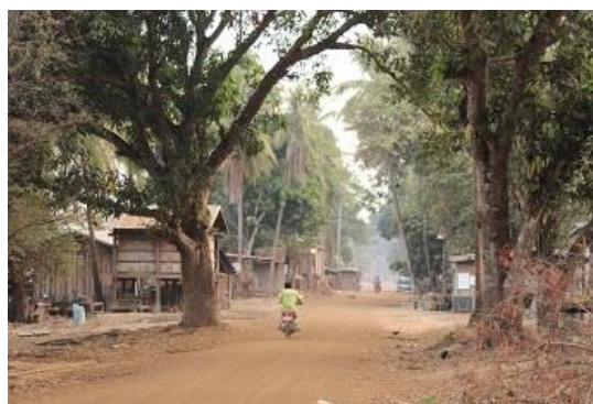
水没する前のスレコー村 (2013)

2012年11月と2013年2月に、州政府は貯水池内の村で会合を開催した。出席した村人によると、州政府は、新たな移転地としてセコン川沿いの土地を提示し、居住地と農地の補償を約束した。しかし、詳細な情報や書類を得た住民は少ない。