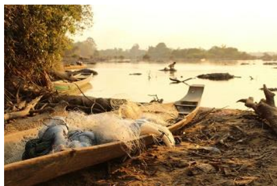
スレコー村よりセサン川を臨む (水没前、2013年)

LS2は「建設・運営・譲渡方式」(BOT)の事業である。40年の操業後にカンボジア政府へ譲渡される。政府の発表によれば、発電した電力はカンボジア電力公社へ売電される予定だが、一部はベトナムへ輸出されるとみられる。