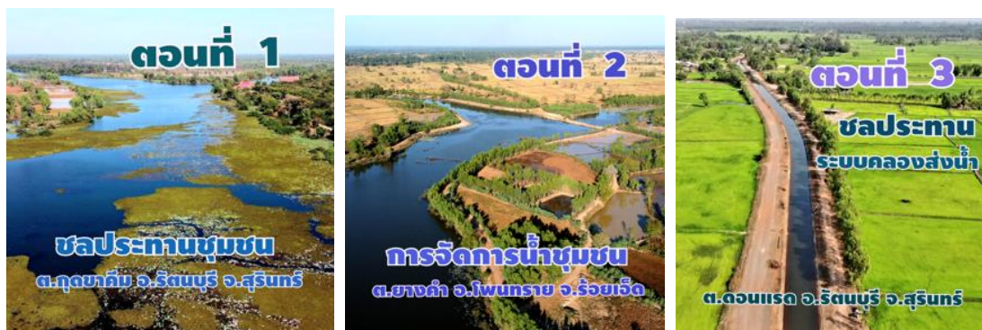
制作した映像の一部